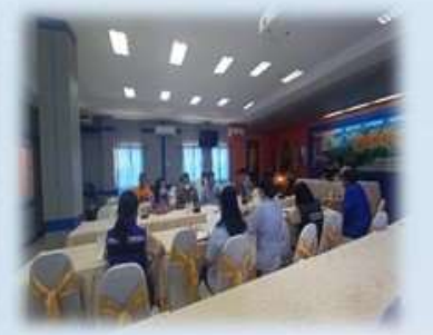
งานสุขศึกษาประชาสัมพันธ์ สำนักงานสาธารณสุขอำเภอจตุรพักตรพิมาน